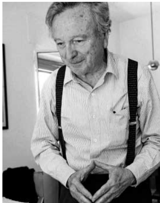
El arquitecto Rafael Moneo.