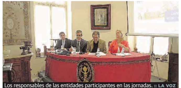
Los responsables de las entidades participantes en las jornadas.