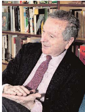
Rafael Moneo. LA VOZ

Con esta nueva conferencia continúa el Ciclo Ultramar, que nació con el objetivo de contribuir a enriquecer los actos culturales conmemorativos de la celebración del Bicentenario de la Constitución de 1812, fruto del convenio de colaboración suscrito entre el Colegio Oficial de Arquitectos de Cádiz y el Consorcio.