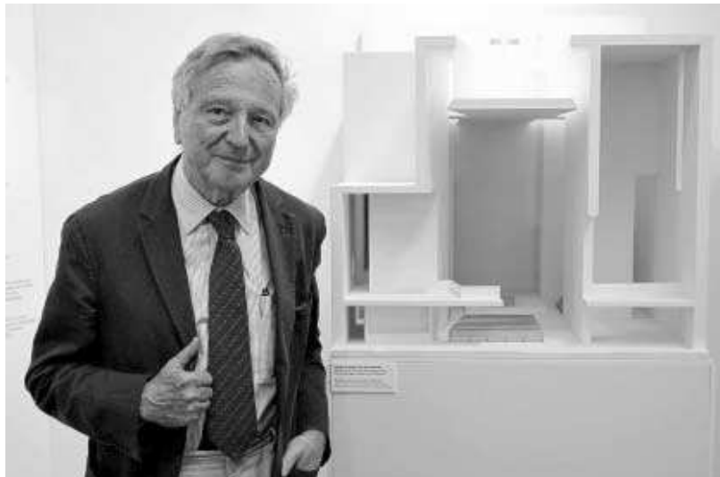
Rafael Moneo, último premio Príncipe de Asturias de las Artes.

El Ciclo Ultramar nació con el objetivo de contribuir a enriquecer los actos culturales conmemorativos del Bicentenario, fruto del convenio de colaboración suscrito entre el Colegio Oficial de Arquitectos y el Consorcio. El invitado de hoy, nacido en Tudela (Navarra) en 1937, estudió en la Escuela de Arquitectura de Madrid,