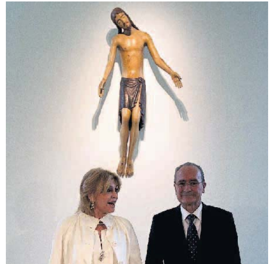
La baronesa y el alcalde posan con la talla de un cristo anónimo.