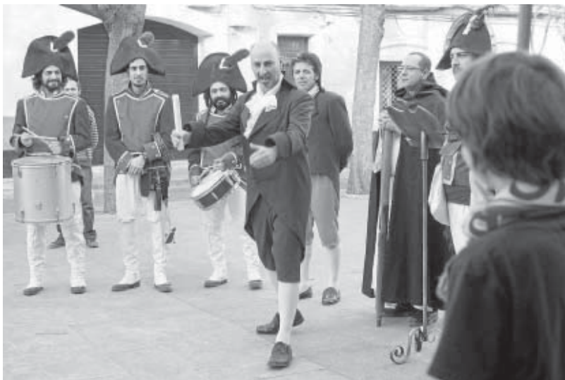
Un pasacalles, que incluía microactuaciones teatrales, recorrió ayer las calles del centro.

Como inicio de la iniciativa, ayer tuvo lugar un pasacalles que, partiendo de la plaza del Mentiadero, recorrió la plaza San Antonio, calle